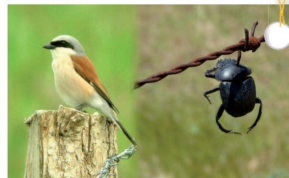
Pespièche écorchée & son Laridior (gandé mangier)