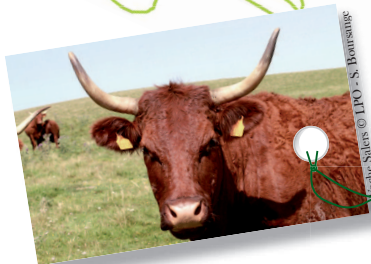
Patrice Saliers