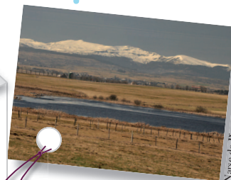
Narse de Pierrefitte

Des réflexions ont été engagées entre la LPO Auvergne et les propriétaires sur les deux autres sites, en partenariat avec le CEN Auvergne.