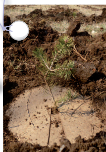
Plant de Pin sylvestre

Déjà deux placettes ont été créées à proximité du site, la première à Chastel sur Murat, sur l'ancienne décharge, et une deuxième à Saint-Flour avec le Lycée agricole Louis Mallet.