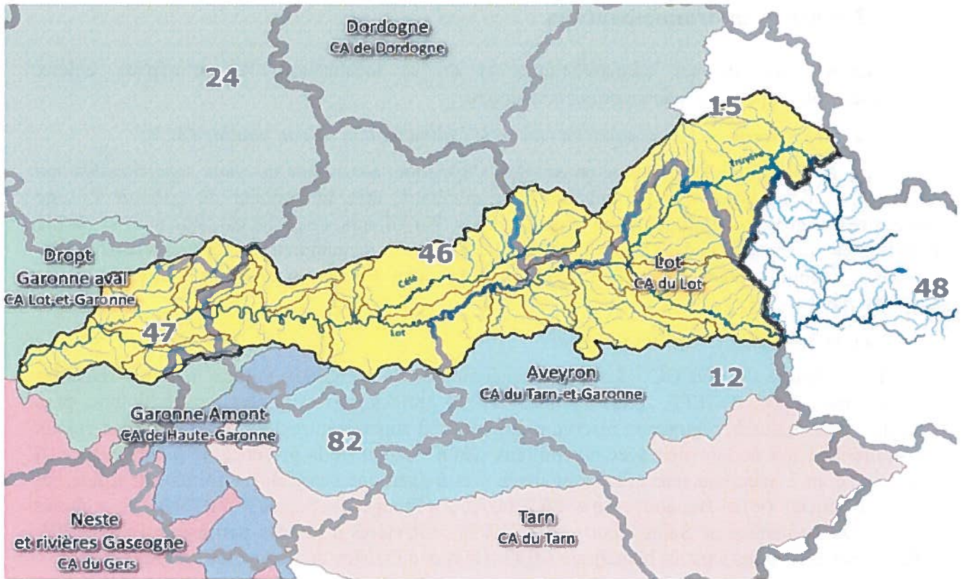
Figure 1 : situation du périmètre de l'organisme unique « du bassin Lot » et des organismes uniques voisins